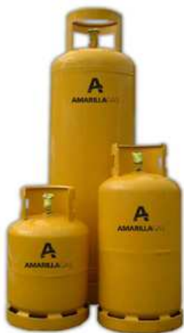
Garrafas de 10 y 15 y cilindro de 45 kg

Los usuarios del GLP como combustible en garrafas están ubicados principalmente en localidades alejadas de los gasoductos principales y troncales o en barrios sin redes de distribución de gas natural en poblaciones de menores recursos. Generalmente son poblaciones chicas cuyo abastecimiento de este producto (GLP) es fundamental durante el invierno. Es por ello que el transporte y distribución con garrafas tiene una importancia social vital para estas poblaciones. El precio del Gas Natural por redes (metano principalmente) es muy inferior al del GLP en garrafas.